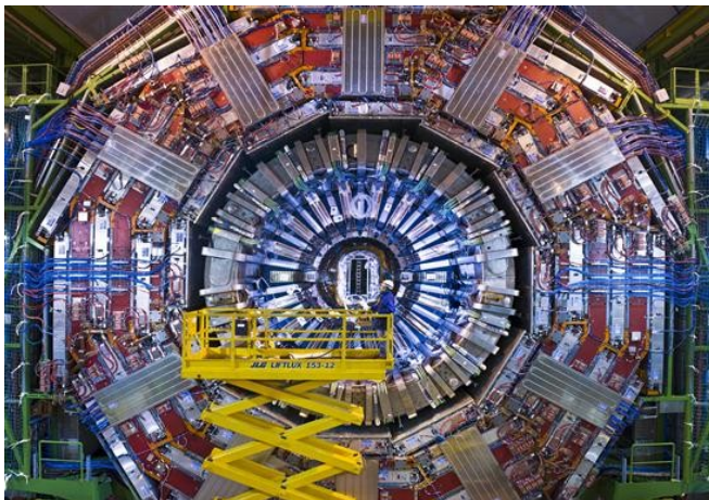
A CMS detektor belseje

A kísérletek detektorainak, észlelőberendezéseinek feladata, hogy a felgyorsított részecskék kis térrészbe koncentrált ütközéseiben keletkező több ezer részecske tulajdonságait, tömegét és impulzusát azonosítsák. Legtöbb magyar fizikus a CMS, a Compact Muon Solenoid kísérletben